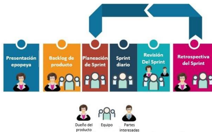
Figura 2. Eventos y roles de Scrum involucrados en cada uno

La Figura 2 muestra los eventos de Scrum, detallando los roles que están involucrados en cada uno