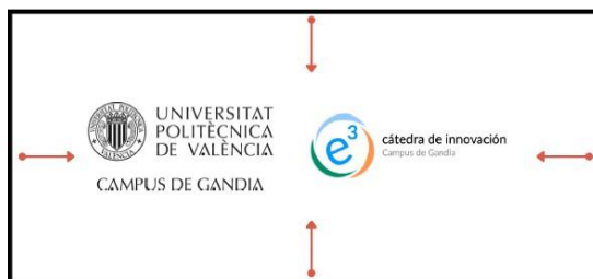
Figura 4. Fin de un podcast multimedia.